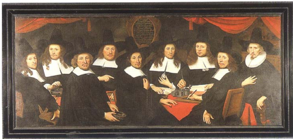
Die Hauptdiakone der Hussittenden Armen, gemalt von Alexander Sanders 1665

Als die Glaubensflüchtlinge aus Flandern, Brabant und den Niederlanden nach Emden kamen, war die hiesige Diakonie überfordert. Emden wuchs rasant schnell an, in wenigen